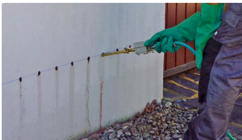
1 | Mise en œuvre d'un traitement contre l'humidité ascensionnelle par injection.

Il est à souligner que tous les produits d'injection à base de silane et/ou de siloxane ne seront pas forcément efficaces. L'efficacité du traitement dépend en effet en grande partie de la formulation spécifique du produit (laquelle influence sa migration, par exemple) et de la composition chimique du composé actif. Il convient également de signaler que certaines catégories de produits,